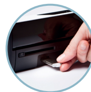
Scansione su USB