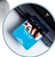
Slot per schede in plastica